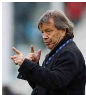
Autor. El padre de la criatura.

El título se suma a su legado en el Pirata, consolidado originalmente en 2011 durante el recordado ascenso ante el propio River Plate. Como principal artífice del