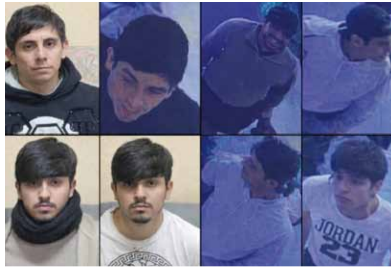
Aprehendidos. Integrantes de la banda que robaba a deportistas.

En el marco por el fin de semana largo, se desplegó un amplio operativo en la terminal de Retiro y en este contexto los efectivos "detectaron a dos hombres que intentaban abordar un micro con destino a la ciudad de Posa-