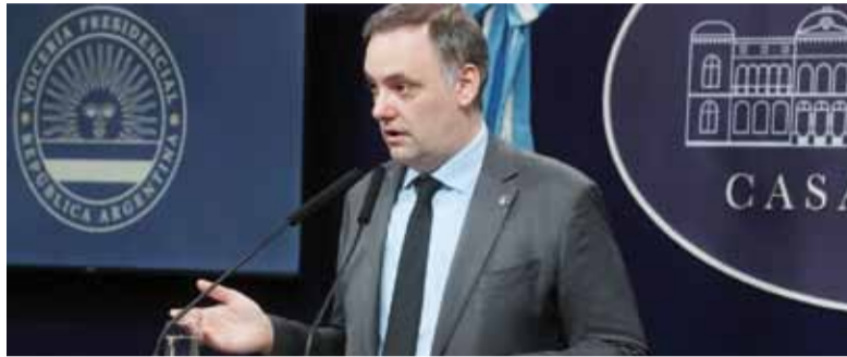
Investigado. El jefe de Gabinete, Manuel Adorni.