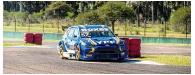
Dominio. Inobjetable performance de la Chevrolet sobre la pista.

El piloto de Chevrolet se quedó con la cuarta fecha en el autódromo "Martín Miguel de Güemes"; Stang y Riva completaron el podio.