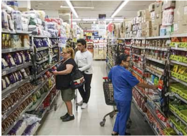
Frágil. En abril, caídas en las compras de alimentos y en supermercados.

En paralelo, el Instituto Nacional de Estadística y Censos (Indec) informó que el consumo durante marzo en supermercados cayó 5,1% interanual, en autoservicios mayoristas, 7,2% respecto del mismo mes de 2025, y en shoppings retrocedió 13,3%. Al analizar este comportamiento, el Banco Provincia hizo referencia a "la magra coyuntura a la que se encuentra expuesto el ingreso disponible de las fami-