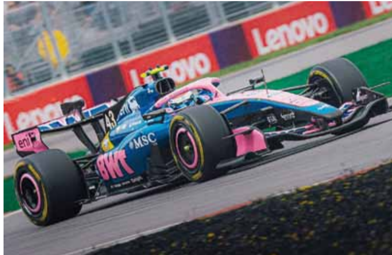
Notable. Actuación consagratoria del bonaerense en Canadá.

Luego de clasificar décimo, Colapinto avanzó inmediatamente