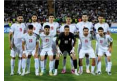
El plantel concentrará en Tijuana.

La Selección de Irán modificará su planificación para el Mundial 2026 y trasladará su campamento base desde Estados Unidos hacia México, luego de recibir la aprobación de la FIFA.