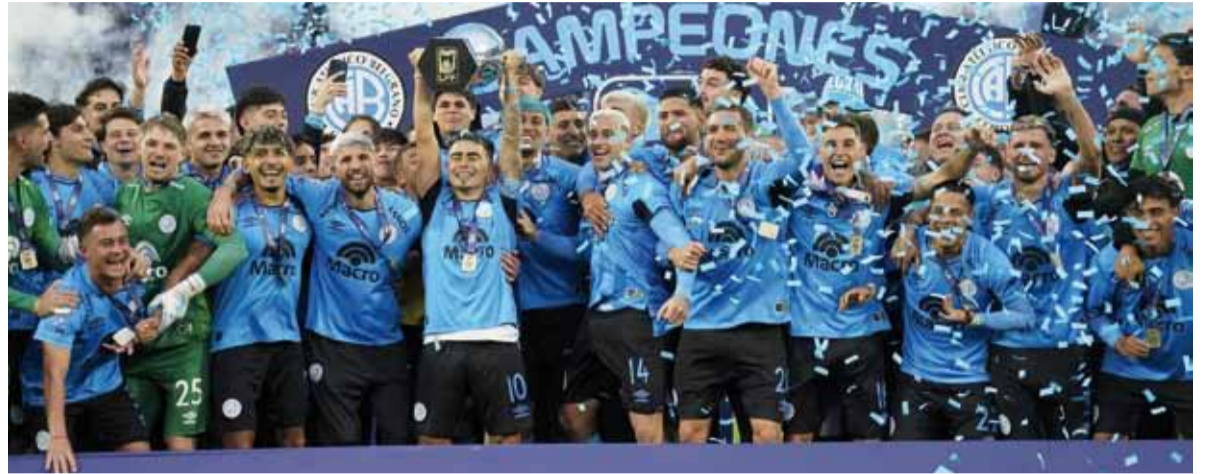
Gloria. El Pirata se adueñó del Torneo Apertura y estrenó su vitrina a lo grande.

La final tuvo todos los ingredientes de un partido histórico: intensidad, cambios de dominio, polémicas y una remontada épica en los minutos finales. Desde el comienzo, el encuentro mostró un ritmo frenético. Belgrano salió decidido a imponer condiciones, aunque el primero en golpear fue River. A los 18 minutos, una desatención defensiva del conjunto cordobés permitió que Facundo