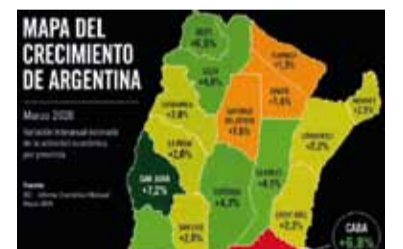
XXXXX. La imagen que compartió Javier Milei.