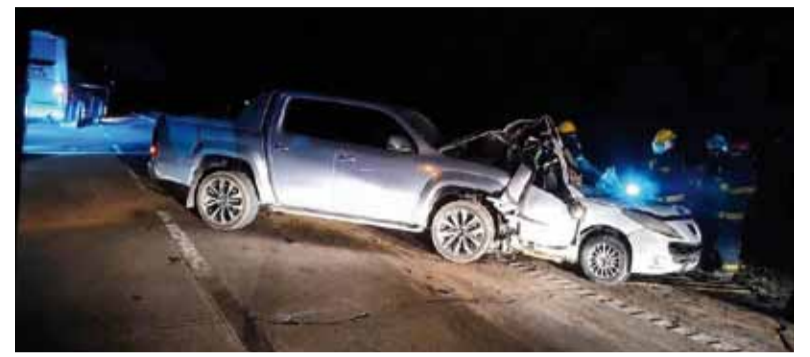
Tragedia. El hecho se produjo en el kilómetro 53, en la mano que conduce hacia Cañuelas.

Una Volkswagen Amarok gris chocó por alcance a un Peugeot 207 blanco que circulaba en el mismo sentido.