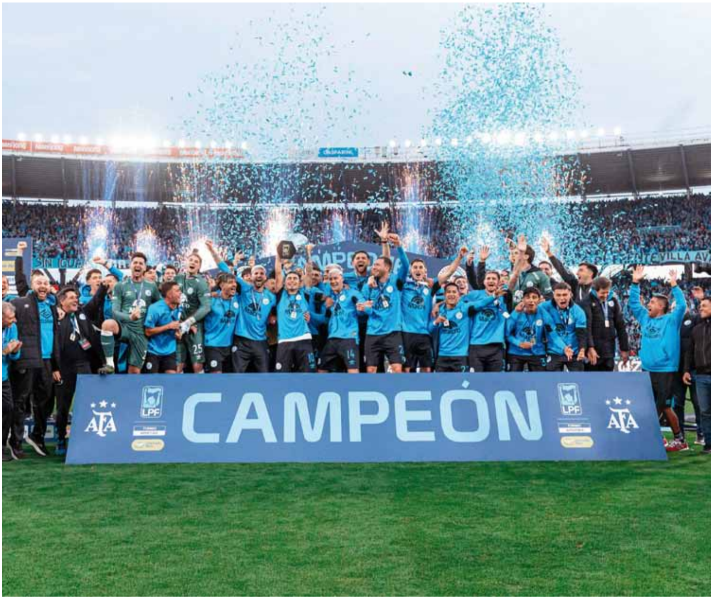
■ Locura en "La Docta", Belgrano lo dio vuelta y le ganó el título al River de Coudet.