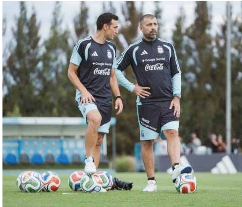
Enfocado. El DT define a los elegidos.

La Serie A también tendrá un fuerte aporte a la convocatoria. Lautaro Martínez llegará tras otra temporada destacada con el