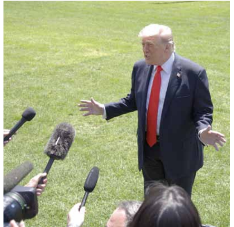
Postura. "El bloqueo permanecerá en pleno vigor y efecto hasta que se llegue a un acuerdo", según Donald Trump.

La balacera, que incluyó entre 20 y 30 disparos cerca del jardín Este, obligó al confinamiento preventivo de los equipos de prensa que se encontraban en el lugar cubriendo las negociaciones diplomáticas para un acuerdo de paz con Irán.